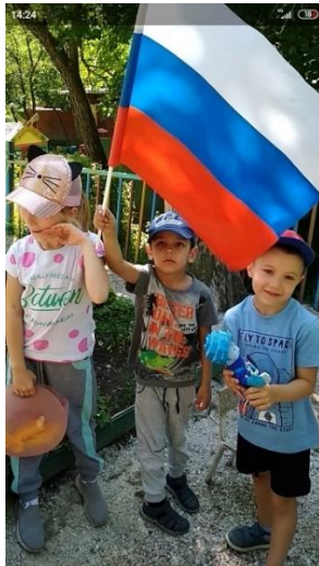
Φοτο Νο 10