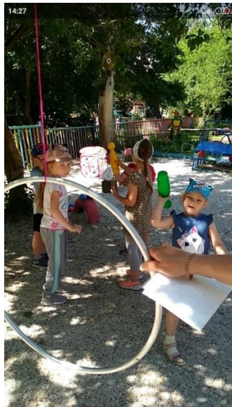
Φοτο Νο 13