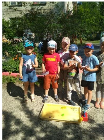
Φοτο Νο 7