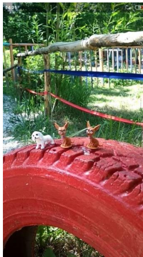
Φοτο Νο 11