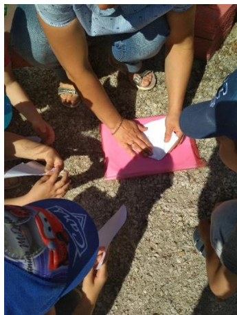
Φοτο Νο 5