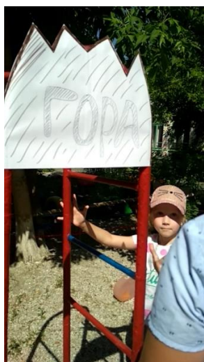
Φοτο Νο 9