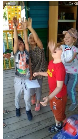
Φοτο Νο 16