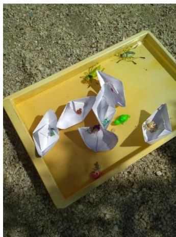
Φοτο Νο 6