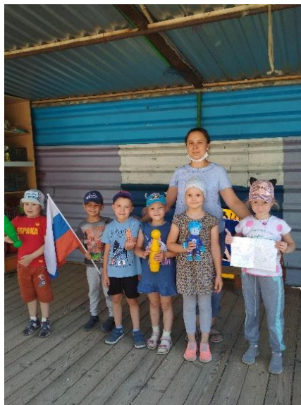
Φοτο Νο 15