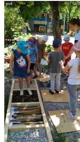
Φοτο Νο 8