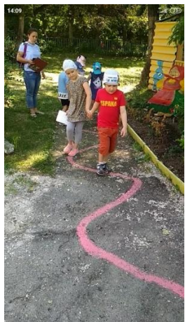
Φοτο Νο 4