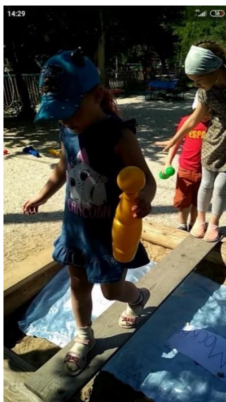
Φοτο Νο 14