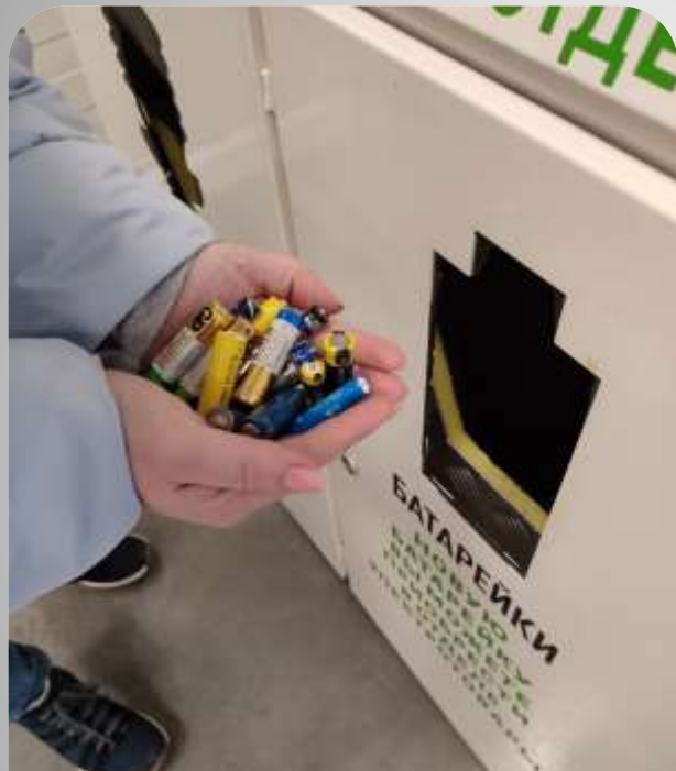
Акция «Батарейки сдавайте»