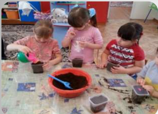
Эксперимент «Как разлагается мусор?»