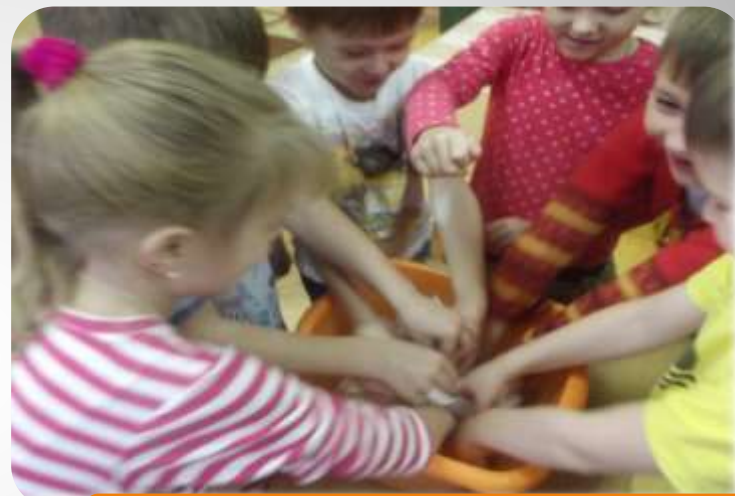
Опыт «Изготовление новой бумаги»