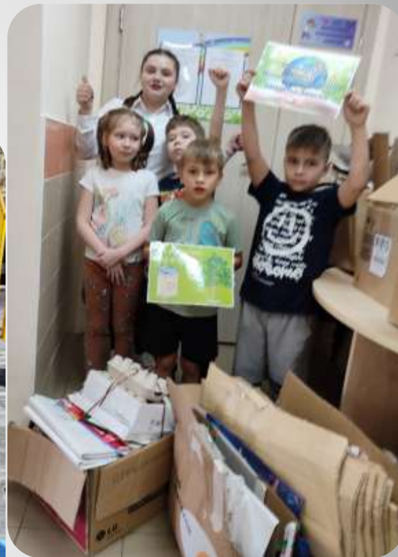
Акция «Собери макулатуру»