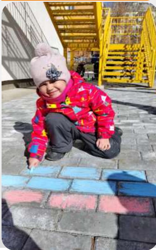
Акция «Зажги синим»