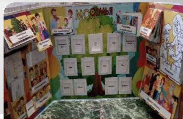
Лэпбук «Моя семья»